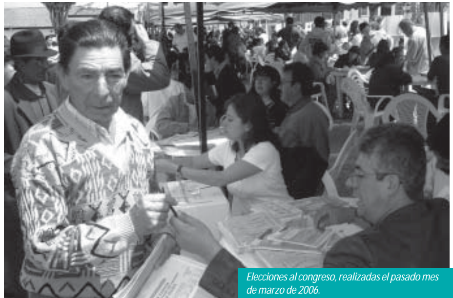
Elecciones al congreso, realizadas el pasado mes de marzo de 2006.

La representación de la sociedad que la Constitución le asigna al Procurador General, requiere que él haga presencia a través de sus distintos funcionarios durante toda la jornada electoral, para desplegar toda su actividad de prevención en procura de fortalecer la confianza en las instituciones del Estado y en los mecanismos de participación ciudadana. ●