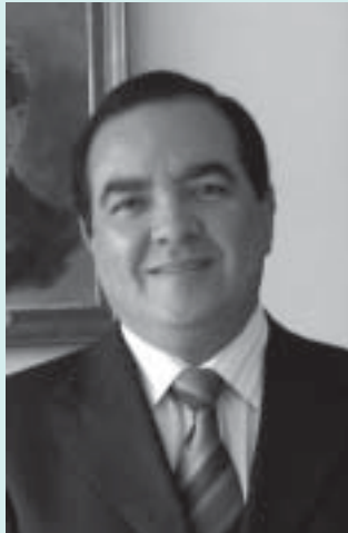
Edgardo José Maya Villazón, Procurador General de la Nación.