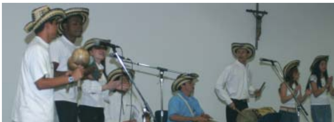
El grupo Chirimía de la Universidad Incca de Colombia amenizó el día de la secretaría en la Procuraduría General de la Nación al ritmo de la música tradicional colombiana.

Al ritmo de la música tradicional colombiana, nuestras secretarías y secretarios celebraron su día el pasado 26 de abril en la sede central.