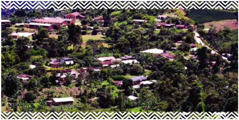
Resguardo indígena de Cristianía Antioquia

El patrón disperso de asentamiento de los pueblos Embera los ubica en diferentes departamentos del territorio colombiano, y en asentamientos en los países de Panamá y Ecuador.