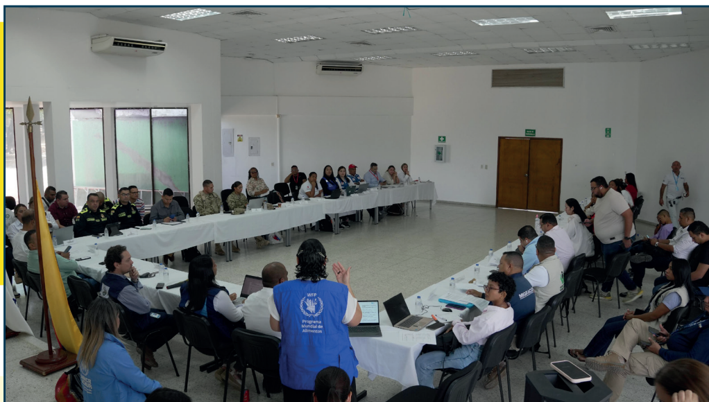
Fuente: Natalia Cifuentes Arboleda Procuraduría Delegada para la Defensa de los Derechos Humanos. 2026