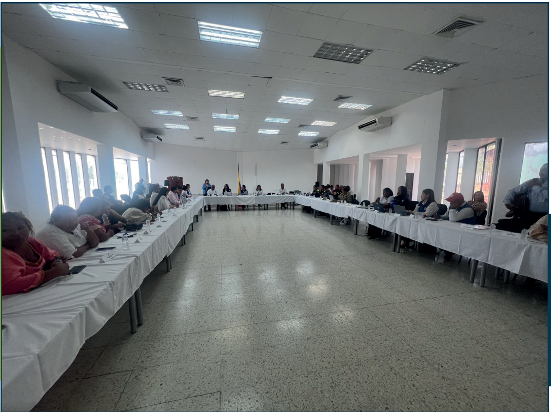
Fuente: Lisbeth Zabaleta Procuraduría Delegada para la Defensa de los Derechos Humanos. 2026