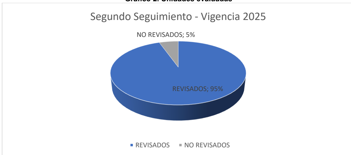
Gráfico 2. Unidades evaluadas

Para el segundo trimestre , se tomó como base el 56% restante, correspondiente a 258 hallazgos pendientes. No obstante, una de las dependencias, Procuraduría Regional de Arauca —que concentraba 14 hallazgos— no pudo ser analizada por el auditor asignado, motivo por el cual el universo real de revisión para este periodo se ajustó a 244 hallazgos. En consecuencia, se logró cubrir el 94,57 % del total originalmente programado para seguimiento en este trimestre.