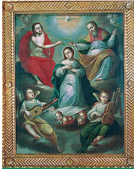
Pintura de la época de la colonia

Es necesario renovar el espíritu de este Convenio como instrumento "tendiente a lograr una efectiva cooperación entre instituciones culturales y no culturales, para disminuir los peligros de hurto, excavaciones clandestinas y comercio ilegal del patrimonio cultural colombiano".