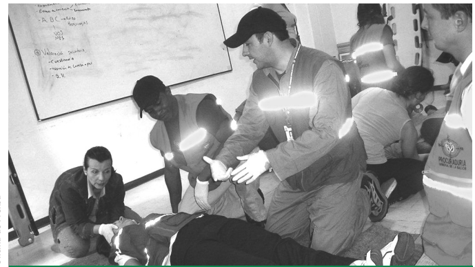
Oficina de Prensa Capacitación en primeros auxilios para miembros de la Brigada de Emergencias.

La mejor manera para afrontar estas situaciones es prepararnos para responder acertadamente como primer contacto ante una urgencia o emergencia.