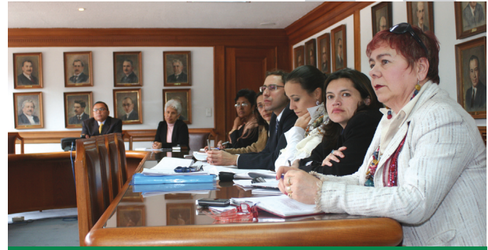
Oficina de Prensa

El Comité esta conformado por la Delegada para los Derechos Humanos y Asuntos Étnicos, el Instituto de Estudios del Ministerio Público, la Delegada Ambiental y