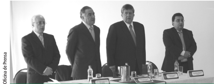
Oficina de Prensa

El seminario contó con la participación de tres eximios conferencistas extranjeros: el profesor