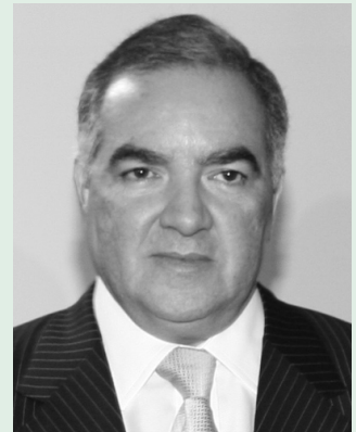
Oficina de Prensa

En consecuencia, la Procuraduría General de la Nación inició las investigaciones disciplinarias correspondientes, e hizo un llamado a todos los entes que tienen responsabilidad en todos los niveles, para que se analice esta problemática y se tomen medidas definitivas. Es necesario diseñar e implementar planes que establezcan mecanismos y acciones efectivas que acaten los requerimientos de ley, así como definir correctivos para mitigar la problemática, y por supuesto, destinar los recursos necesarios para llevar a la realidad los planes formulados.