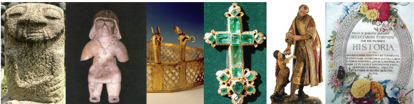
Piezas del patrimonio cultural colombiano.