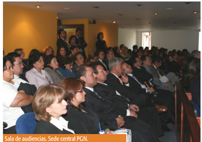
Sala de audiencias. Sede central PGN.