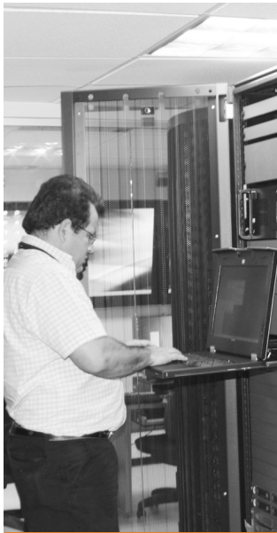
Construir y optimizar la plataforma tecnológica de la institución es uno de los objetivos del proyecto de modernización de la PGN.