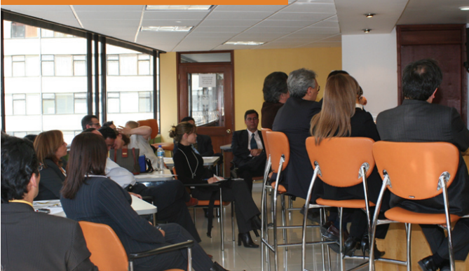
Cafetería. Sede central PGN.

en el que se podían formular las preguntas, dudas e inquietudes respecto a la gestión adelantada y además, tuvieron la posibilidad de evaluar la rendición de cuentas 2007. Adicionalmente, a través de Señal Institucional se presentaron dos emisiones de la rendición de cuentas en diferido los días 31 de enero y 1º de febrero de 2008. ●