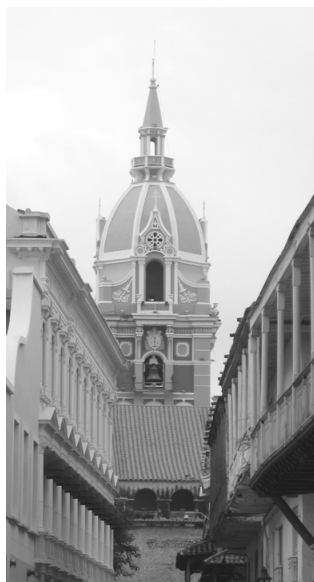
La PGN vela por garantizar todos los esfuerzos para la defensa del patrimonio público.

• Objetivo 2: Ejercer seguimiento y control de la ejecución de los recursos públicos provenientes de las regalías y propender por la normalización de la deuda pública por parte de los entes territoriales.