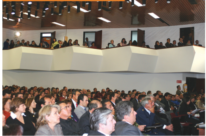
Auditorio Antonio Nariño. Sede central de la PGN