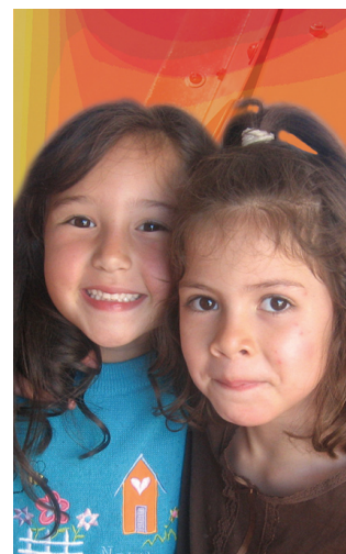
Uno de los objetivos en materia de niñez es velar por los derechos y garantías de los niños y niñas en situación de difícil adopción.

• Objetivo 1: Seguimiento a la política pública para la garantía de los derechos humanos de la infancia y la adolescencia.