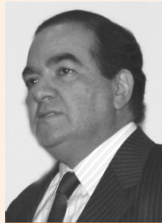
Oficina de Prensa

Es una rendición de cuentas social en la medida que califica y valoriza las acciones realizadas durante mi administración a favor de los portadores de intereses, o mejor, portadores de derechos; muestra o ilustra el quehacer social, ambiental, político, económico en un marco de cumplimiento de