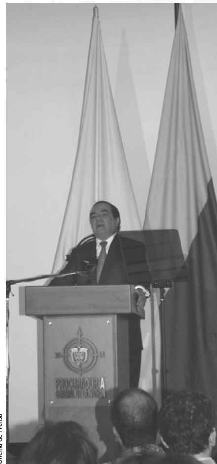
Oficina de Prensa

El Procurador General de la Nación durante la rendición de cuentas 2007, con balance social. Bogotá, auditorio Antonio Nariño, 28 de enero de 2008.