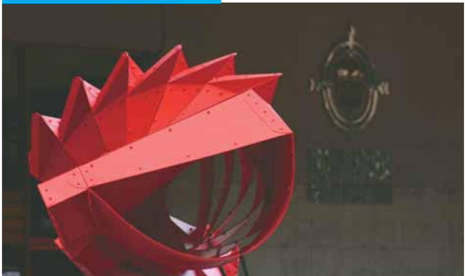
Oficina de Prensa

Escultura Dinamismo del Maestro Negret, ubicada en la entrada principal del edificio central de la pgn.