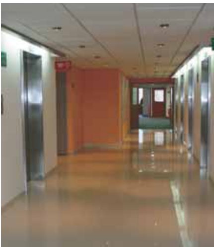
Oficina de Prensa

La renovación de espacios en nuestra Entidad ha sido impulsada por la innovación tecnológica que de paso ha favorecido la organización misma y el bienestar de quienes en su nombre servimos. Ello indica la coherencia de la planeación de los cambios arquitectónicos, de diseño y de espacio con la tendencia en el mundo al revolucionar los edificios públicos con la idea de que la administración pública, tradicionalista, formal y burocrática, se renueve con imágenes armoniosas que desdibujen aquellas que se han estratificado en la memoria de todos como sedes deshumanizadas. ●