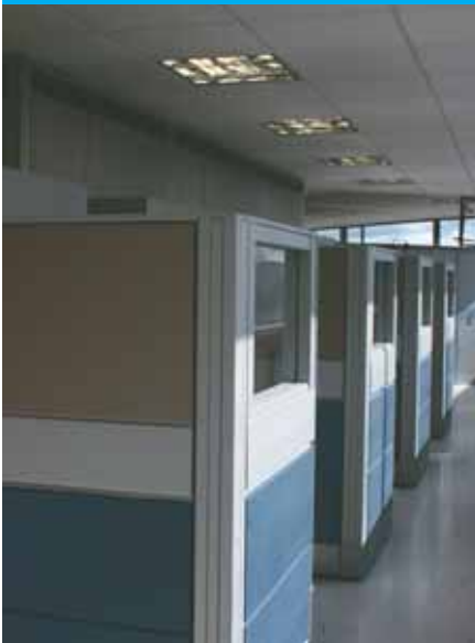
Oficina de Prensa

Pasillo interior de la Oficina de Prensa, en el piso 21, donde además están ubicadas la Sala Disciplinaria y la Oficina de Asuntos Internacionales.