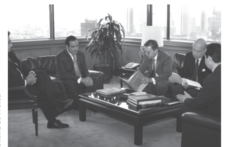
Oficina de Prensa