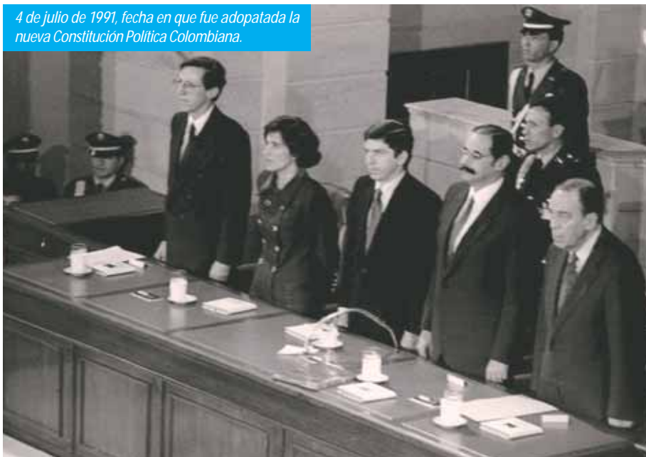
4 de julio de 1991, fecha en que fue adoptada la nueva Constitución Política Colombiana.

La Procuraduría General de la Nación que a lo largo de su historia, salvo unos intervalos muy cortos, estuvo adscrita al poder Ejecutivo o del Legislativo, dependía de dichos poderes. Con la Constitución de 1991 pasó a ser un ente autónomo e independiente del resto de los órganos del Estado, autonomía e independencia que le permitirían ejercer en forma eficaz y eficiente las múltiples funciones asignadas por el Constituyente. En este orden, la Procuraduría General de la Nación asumió una función de control que inicialmente