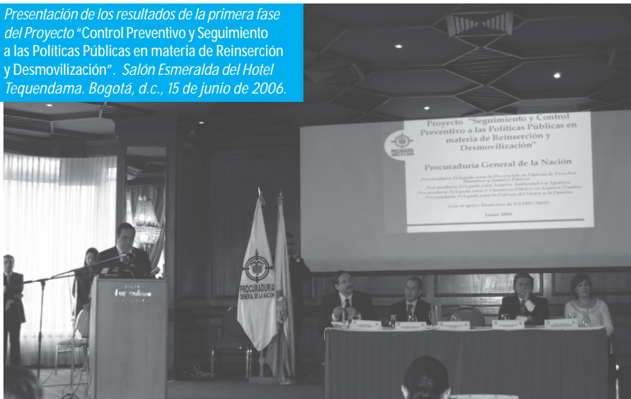
Oficina de Prensa

Presentación de los resultados de la primera fase del Proyecto "Control Preventivo y Seguimiento a las Políticas Públicas en materia de Reinserción y Desmovilización". Salón Esmeralda del Hotel Tequendama. Bogotá, d.c., 15 de junio de 2006.