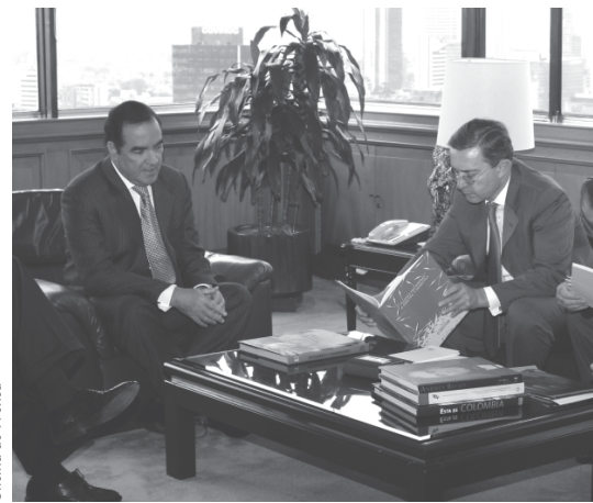
Oficina de Prensa

Presentación de los resultados de la primera fase del Proyecto "Control Preventivo y Seguimiento a las Políticas Públicas en materia de Reinserción y Desmovilización". Salón Esmeralda del Hotel Tequendama. Bogotá, d.c., 15 de junio de 2006.