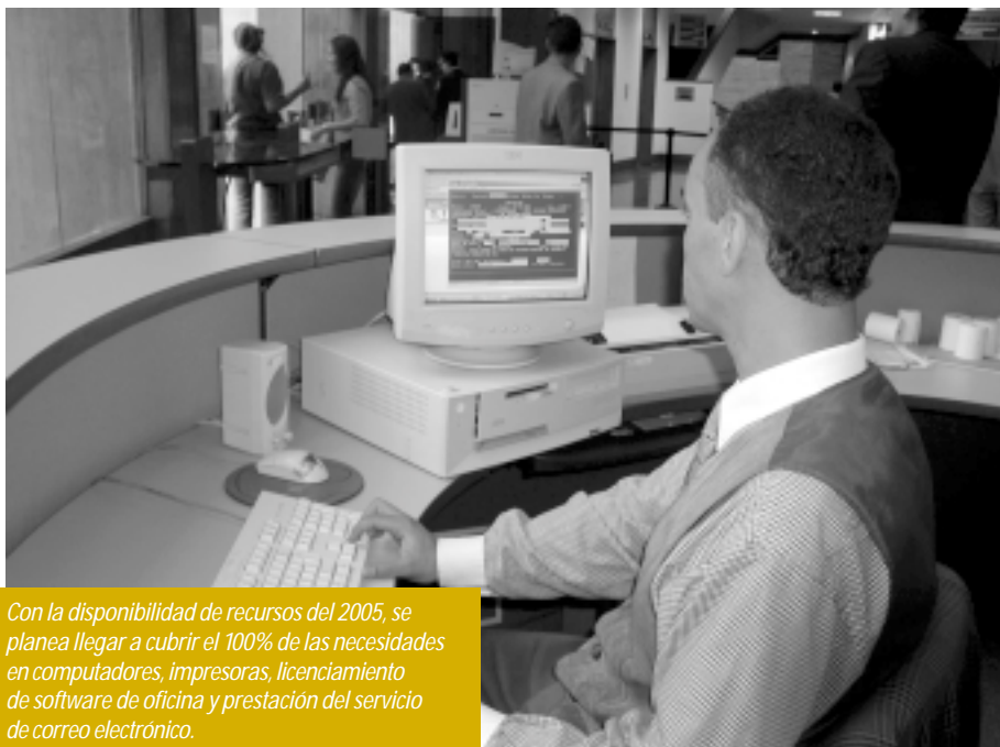
Con la disponibilidad de recursos del 2005, se planea llegar a cubrir el 100% de las necesidades en computadores, impresoras, licenciamiento de software de oficina y prestación del servicio de correo electrónico.

y medir el impacto de las intervenciones de las procuradurías judiciales, ante jueces y tribunales.