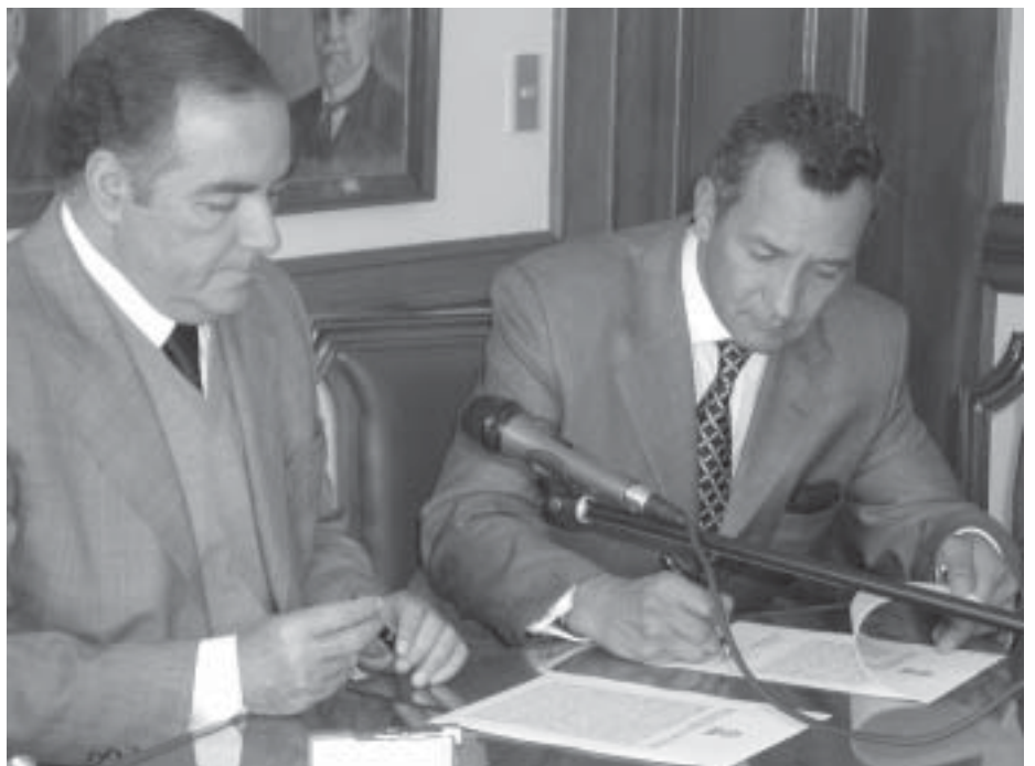
Suscripción Convenio Interadministrativo ICFES-PGN en Bogotá.

El nuevo instrumento está al alcance de todos en la página web de la Entidad en la siguiente dirección http://www.procuraduria.gov.co/comunidad/indexcm.html , en donde encontrarán además las estadísticas de actividades, la ficha guía de control y seguimiento, los formularios de calificación de servicios y de período de prueba y el instructivo para la calificación de servicios. ■