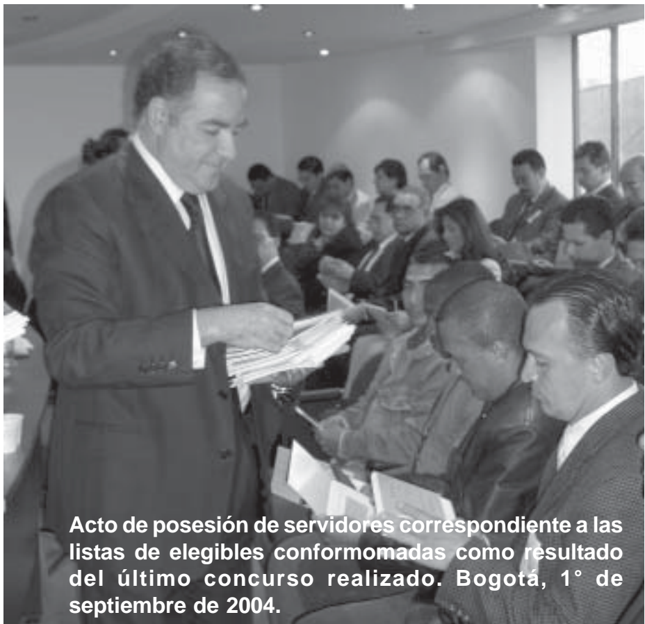
Acto de posesión de servidores correspondiente a las listas de elegibles conformadas como resultado del último concurso realizado. Bogotá, 1° de septiembre de 2004.

Luego de realizar un estudio sistemático y comparativo de la planta de personal de la Entidad, con el fin de identificar los cargos pendientes por proveer en listas de elegibles y al tiempo cumplir con la restricción de cargos reglamentada por el Ministerio de Hacienda que asciende al cuatro por ciento de la planta de personal, se determinaron los cargos para las convocatorias de 2004.