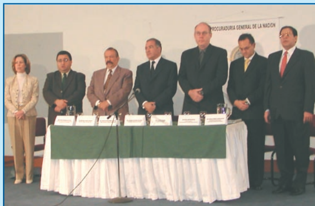
Instalación del taller: "Construcción Código de Ética".

Por ello, se vio la necesidad de iniciar un proceso de construcción de un Modelo de Gestión Ética de la Procuraduría que nos llevara a explicitar, con la ayuda de todos los servidores, los valores éticos y morales que deben regir nuestra actividad funcional y por qué no decirlo, en nuestra cotidianidad, lo cual redundará en beneficio de cada uno de los que aquí laboramos y por ende en una mayor transparencia en la gestión disciplinaria y de lucha contra la corrupción, como filosofía y deber de todo aquel que se encuentre vinculado o se vincule en un futuro a nuestra Entidad.