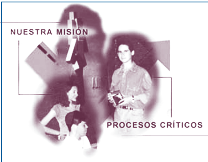
Oficina de Planeación

La dinámica de la vida actual incluye la presencia constante del cambio que puede ser súbito o lento, y es allí donde la planeación entra a jugar su papel fundamental al permitir asimilar las diferencias para adaptarnos a la realidad y a las condiciones objetivas que actúan en el entorno.