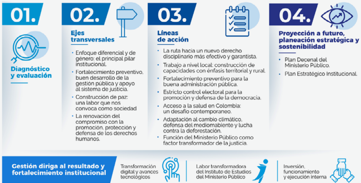
Ilustración 3. Modelo de Buena Gobernanza 2021-2024

La primera etapa contempla un diagnóstico continuo que inició desde el proceso de empalme entre administraciones. Este ejercicio de diagnóstico es permanente en la medida en que se trabaja en identificar problemáticas y soluciones con el fin de adaptarse al dinamismo del quehacer diario en la entidad y responder eficientemente a las necesidades cambiantes de la ciudadanía.