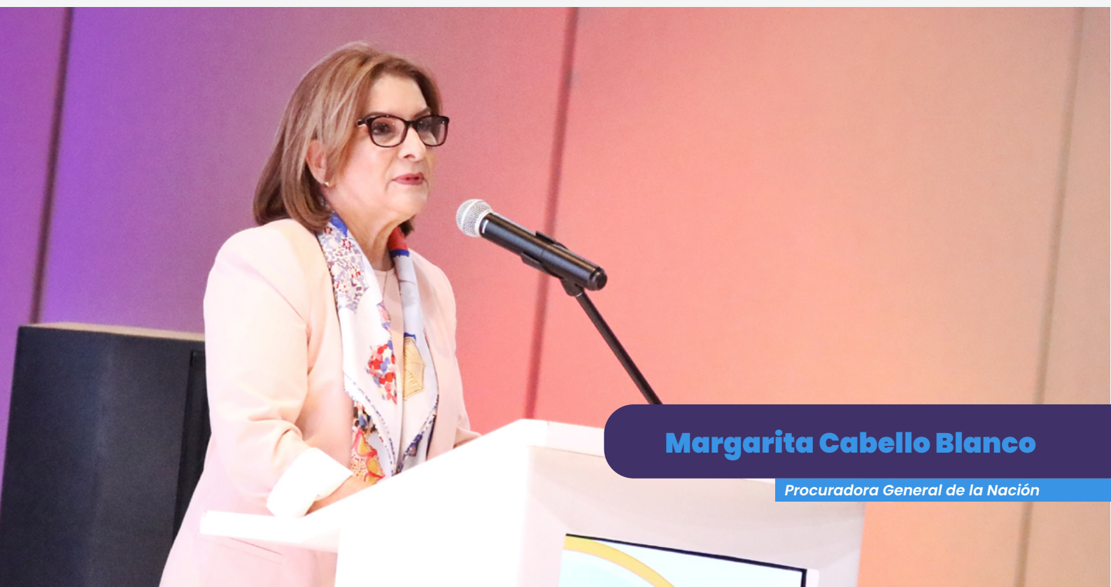
Margarita Cabello Blanco

Definir el sendero que vamos a recorrer en la coyuntura actual ha sido un reto de gran magnitud. Sin embargo, el horizonte es claro. Con este plan enrutaremos nuestro servicio hacia un nuevo paradigma de inclusión y de sostenibilidad. Nuestro compromiso con la ciudadanía es poner en marcha un proyecto de construcción de nación basado en la equidad y en la diferencia, respetuoso y garante de los derechos de las poblaciones minoritarias, articulando las funciones misionales de la entidad, e implementando el trabajo colaborativo con otras ramas del poder público. Como ya lo he dicho, estamos impulsando la generación de un nuevo paradigma de la Procuraduría General de la Nación y espero que este legado perdure en el tiempo para aportar a la transformación permanente de nuestro país bajo los valores esenciales del Estado Social de Derecho.