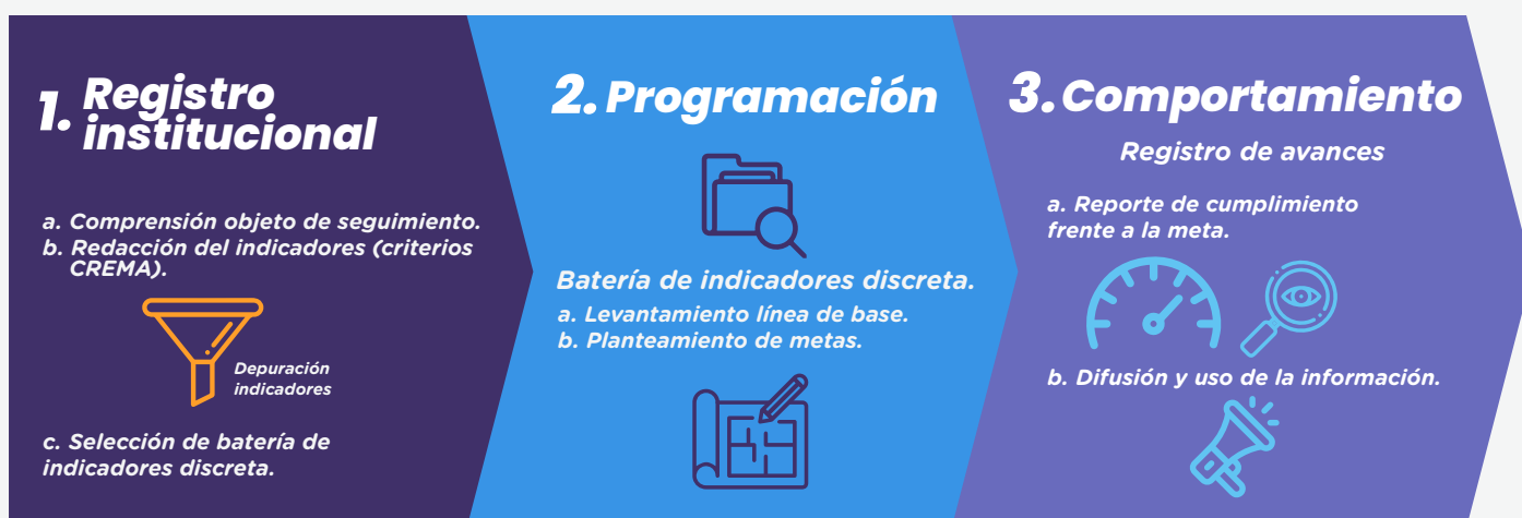
Ilustración 5. Etapas propuestas para la operacionalización de los indicadores del PEI 2021 – 2024 de la PGN