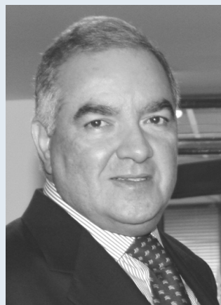
Oficina de Prensa

Es una demostración de que es posible aunar esfuerzos con otras