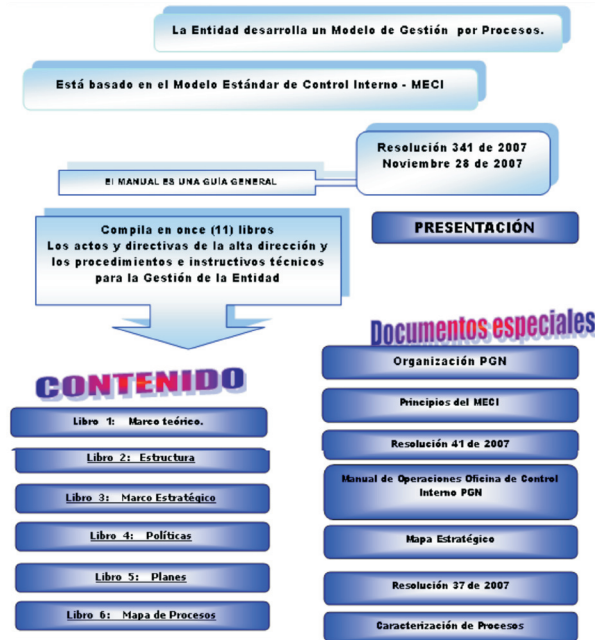
Manual de Operaciones MECI-PGN, página de inicio, mayo de 2008.

La normatividad vigente (decretos 1599 de 2005 y 2913 de 2007) establece que el MECI debe estar implementado en diciembre 7 de 2008. Este modelo ya se encuentra adoptado en la Entidad (resoluciones 228 y 338 de 2006 del Procurador General), su implementación es dirigida por el Comité de Coordinación del Sistema de Control Interno y cuenta con tres equipos: Directivo, evaluador y operativo.