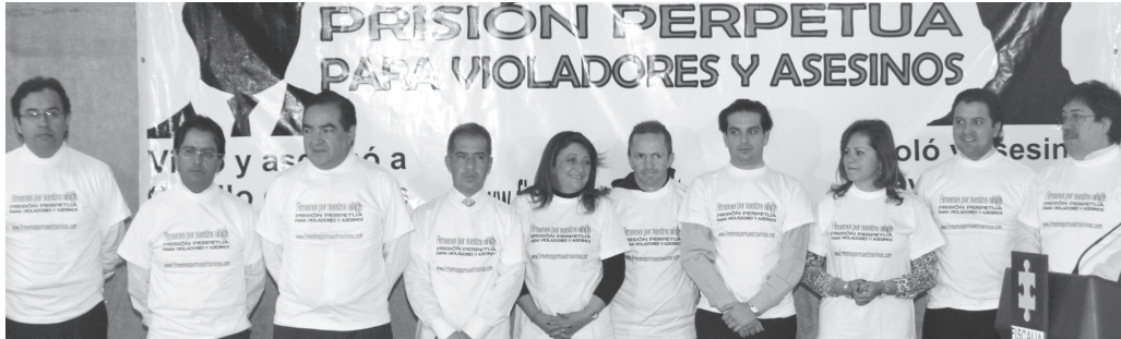
Oficina de Prensa