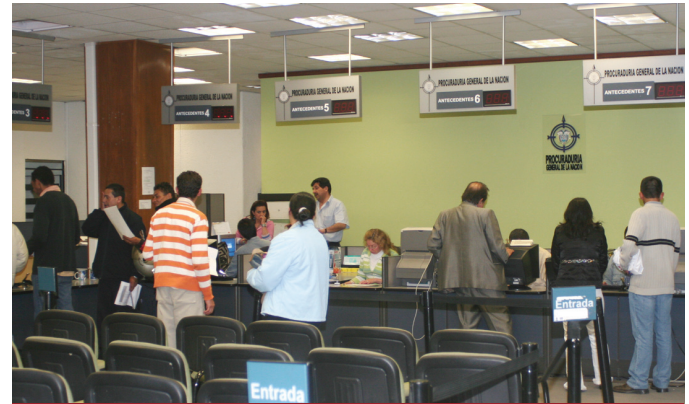
Oficina de Prensa

La Procuraduría garantiza de manera gratuita la disponibilidad permanente de la información electrónica sobre certificación de antecedentes disciplinarios.