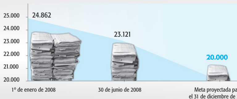
Comportamiento del inventario de expedientes disciplinarios, enero de 2008

De los 24.862 expedientes que conformaban el inventario de procesos disciplinarios de la Entidad al iniciar el 2008, al 30 de junio del mismo año sólo quedan activos 23.121, incluyendo los que han ingresado en el mismo periodo. Sólo faltan 3.121 expedientes por culminar trámite para lograr la meta propuesta para el cierre de la gestión del Procurador General de la Nación, Edgardo Maya Villazón, que es de 20.000 expedientes. Tal avance es el fruto del trabajo de todos los funcionarios que intervienen en este proceso y de todos depende que dicha meta sea lograda satisfactoriamente.