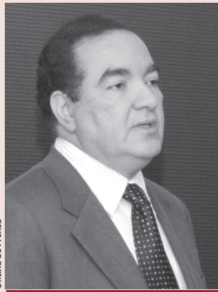
Oficina de Prensa

Edgardo José Maya Villazón, Procurador General de la Nación.