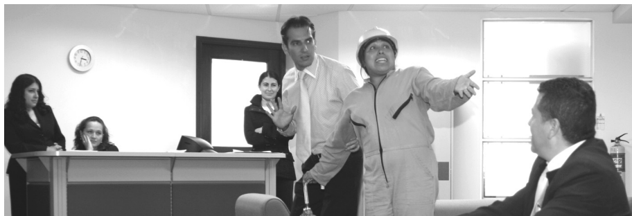
Oficina de Prensa

Campaña de sana convivencia y trato justo desarrollada durante la Semana de la salud ocupacional, julio 28 al 1º de agosto de 2008. Procuraduría General de la Nación, sede central.