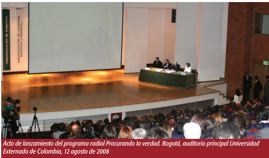
Acto de lanzamiento del programa radial Procurando la verdad . Bogotá, auditorio principal Universidad Externado de Colombia, 12 agosto de 2008

En el eje audiovisual en una primera fase se diseñaron 10 mensajes institucionales,