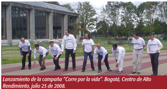
Lanzamiento de la campaña "Corre por la vida". Bogotá, Centro de Alto Rendimiento, julio 25 de 2008.

E l desplazamiento forzado es un delito que ha sido cometido desde hace varias décadas en el país; que ha afectado a miles de personas; que ha violado sus derechos civiles y políticos al igual que sus derechos económicos, sociales y culturales; y que continúa afectando la