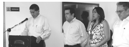
Reinauguración de la sede de la Procuraduría Provincial de Barrancabermeja. 5 de diciembre de 2007.