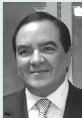
Oficina de Prensa

Logramos en el anterior cuatrienio que los alcaldes y gobernadores trabajaran prioritariamente en la garantía y protección integral de los niños, las niñas y los adolescentes. Los mandatarios que acaban de posesionarse en sus cargos ya asumieron el compromiso, porque los derechos de los menores colombianos son impostergables y esenciales para el desarrollo de nuestra sociedad.