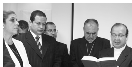
Bendición realizada en el acto de reinauguración de la Procuraduría Regional del Quindío. Armenia, 22 de noviembre de 2007.