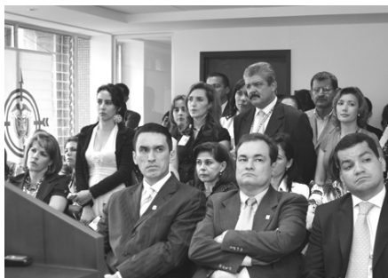
Acto de reinauguración llevado a cabo en la sede de la Procuraduría Regional de Santander. Bucaramanga, 31 de octubre de 2007.