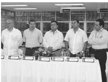
Reinauguración de la sede de la Procuraduría Regional de Atlántico. Barranquilla, 21 de septiembre de 2007.

Más de 20 sedes del ministerio público en todo el territorio colombiano han sido adquiridas, construidas o remodeladas desde el 2005, incluyendo las procuradurías regionales, provinciales, judiciales, centros de atención al público, pisos de la torre central y la obra Dinamismo del escultor Édgar Negret. Esta gestión ha sido posible gracias a recursos del crédito del Banco Interamericano de Desarrollo (BID) y de la Procuraduría. ●