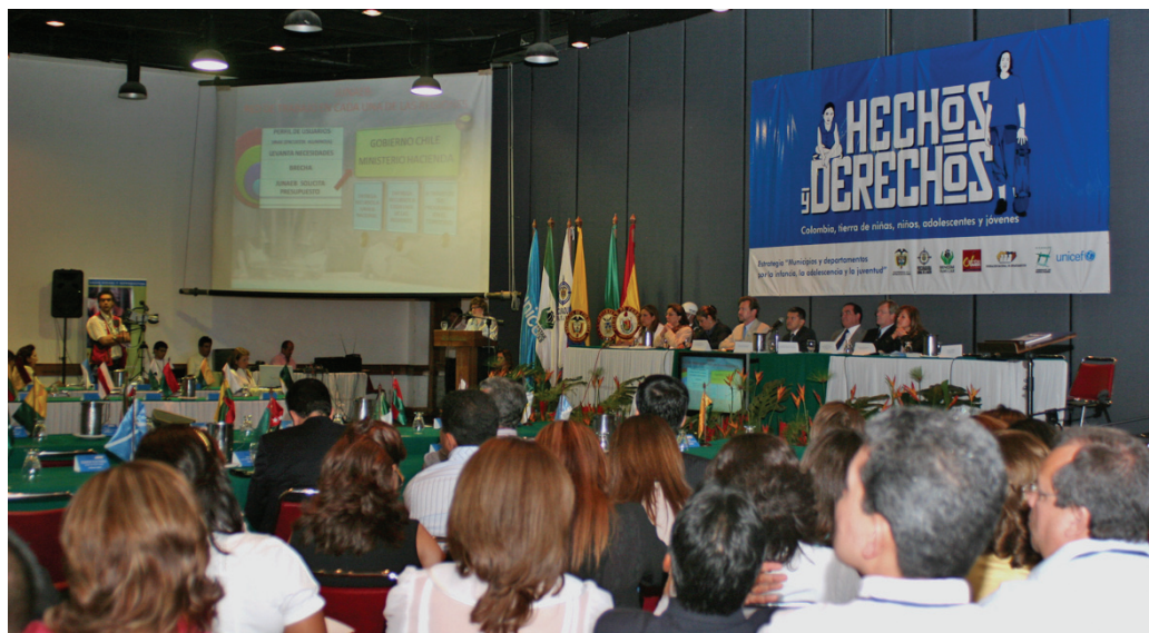
Oficina de Prensa

El acuerdo suscrito se soporta, entre otros argumentos, en que los derechos sociales, económicos, civiles y políticos de los niños, niñas y adolescentes son impostergables, por considerarlos