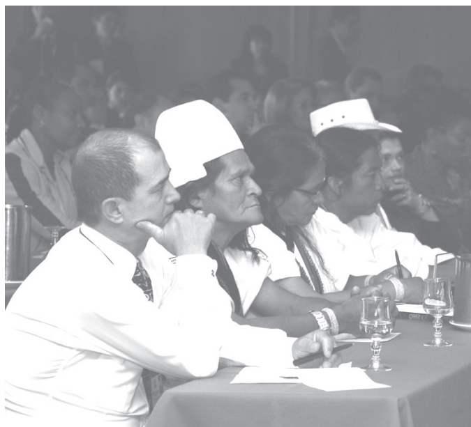
Representantes de nuestros pueblos indígenas, comunidades Afrocolombianas, pueblo Rom y Raizales.

E l pasado lunes 16 de julio de 2007 en las instalaciones del hotel Dann de Bogotá, se llevó a cabo el Taller Internacional de Intercambio de Experiencias, denominado "De los conflictos crónicos, institucionalización de arreglos", organizado y coordinado por la Procuraduría General de la Nación.