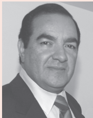
Oficina de Prensa

Es por ello que debemos estar preparados para emprender las acciones de manejo de todos estos eventos, a fin de preservar la obtención de resultados efectivos, mediante una ejecución eficaz de los procesos, resguardar los recursos de daños o pérdidas, garantizar la confiabilidad y oportunidad de la información y, lo más importante, mantener esa buena imagen y credibilidad insti-