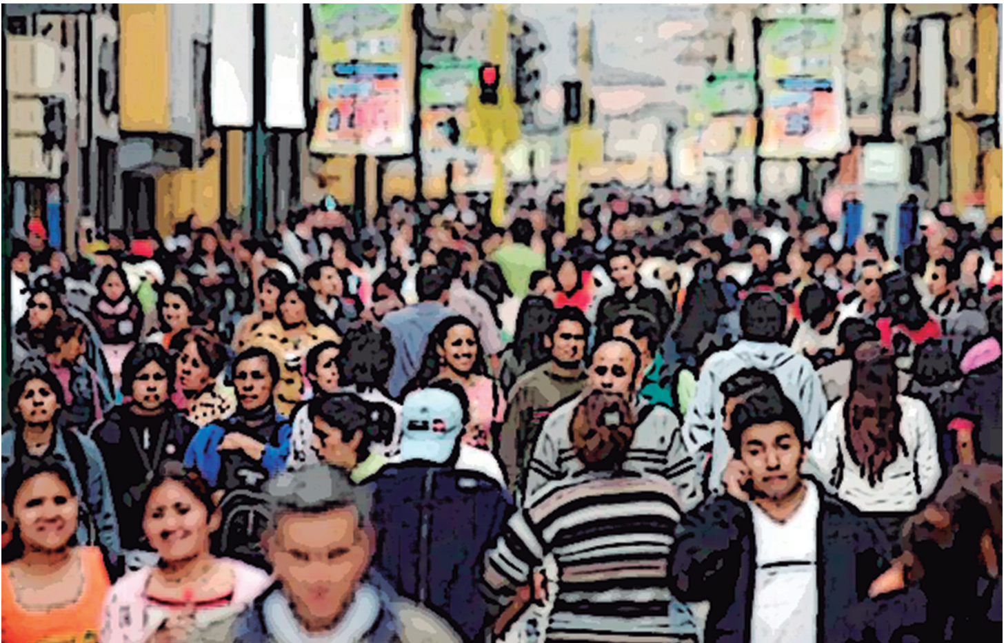
Cinco objetivos claros para proteger a la sociedad tiene el Plan Estratégico 2013-2016.

de los derechos de los ciudadanos y del Estado, y fortalecer la función disciplinaria, con énfasis en el proceso verbal, garantizando oportunidad y calidad.