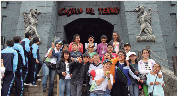
Una mezcla de emoción y angustia se vio en los rostros de los niños al culminar el recorrido por el "Castillo del terror".

Al finalizar esta jornada de esparcimiento, colmada de agradables experiencias, los participantes regresaron felices a casa. P