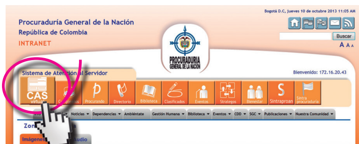
Entrando a intranet.procuraduria.gov.co, opción CAS Virtual.

El CAS virtual fue ideado por la Secretaría General en 2012 y luego de un trabajo coordinado por las oficinas de Prensa y Sistemas de la Entidad, se ejecutó y se puso en marcha este servicio que beneficiará a cerca de los 4.000 funcionarios de manera directa.