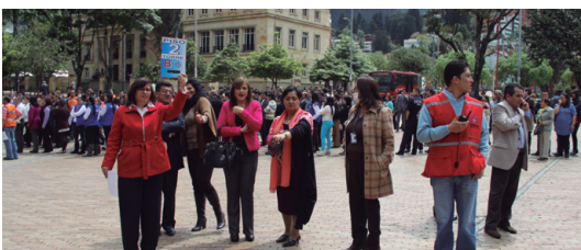
Atentos al llamado a lista.