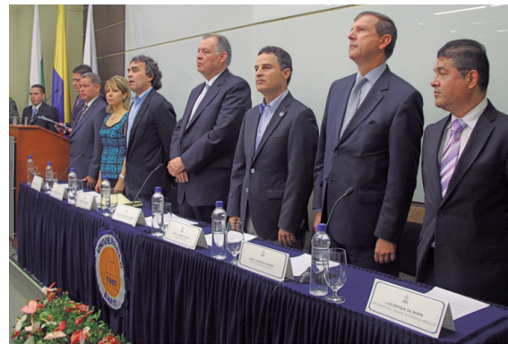
Acto de instalación de la jornada de conciliación extrajudicial en derecho en la universidad EAFIT de Medellín.

Por Juan Pablo García Bedoya Periodista Oficina de Prensa