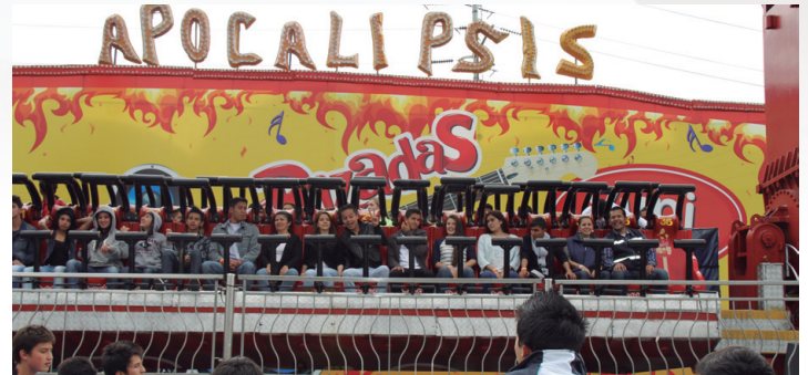
Los mayores experimentaron altas dosis de adrenalina en el "Apocalipsis".