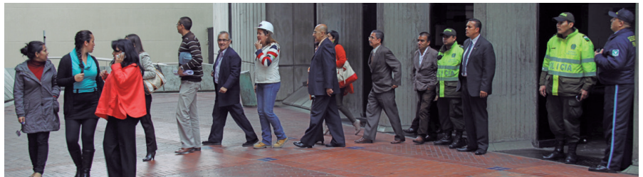
Evacuación de los servidores de la torre B.