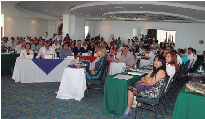
Cerca de 250 asistentes y más de 5.800 mil ciudadanos que siguieron la transmisión del evento vía web, conocieron las propuestas de expertos nacionales e internacionales y autoridades civiles y militares.