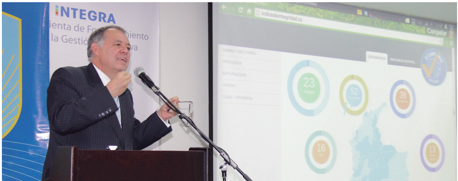
"Quiénes estamos en lo público tenemos que cuestionarnos si ejercemos lo público con responsabilidad", señaló el jefe del Ministerio Público durante sus intervenciones acerca del Índice INTEGRA.

Una de las grandes conclusiones del Índice INTEGRA es que persiste una considerable debilidad en la capacidad de observación por parte de las entidades que tienen dentro de sus funciones el monitoreo de las políticas públicas, los procesos y reportes. Esto obedece a las reservas de cada institución frente a la divulgación de la información, así como la falta de articulación entre las mismas. Es importante entonces generar un cambio cultural en las entidades frente a la importancia del reporte de información y la apertura de datos.