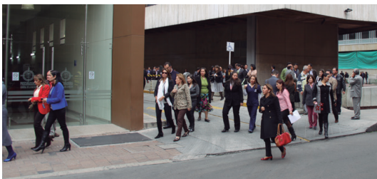
Los servidores de la Procuraduría se dirigen hacia el punto de encuentro establecido.