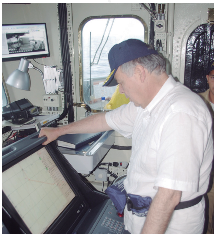
El jefe del Ministerio Público observa la carta de navegación que muestra la ubicación del meridiano 82 sobre aguas colombianas.