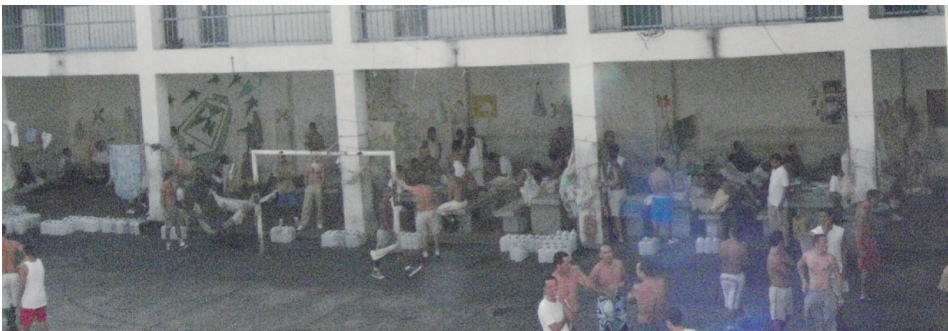
La Procuraduría trabajó en defensa de los derechos de los ciudadanos privados de la libertad.

Víctimas del conflicto, infancia, internos en centros penitenciarios, usuarios de la salud y empleados formales e informales, entre tantos otros sectores de la sociedad, concentraron la gestión preventiva de la Procuraduría General de la Nación en la vigencia 2012.