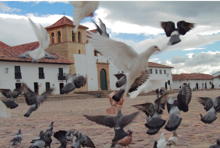
Villa de Leyva, en el departamento de Boyacá, fue el lugar elegido para presentar a los colombianos el Informe de Gestión 2012 de la Procuraduría General de la Nación.