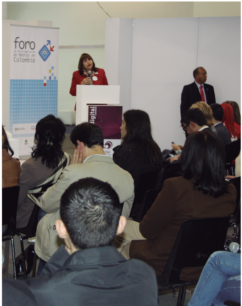
En 2012 la Procuraduría General de la Nación participó en 10 foros por el territorio nacional sobre temáticas de impacto social.

907.748 registros fueron incluidos en el Sistema de Información de Registro de Sanciones y Causas de Inhabilidad (SIRI).