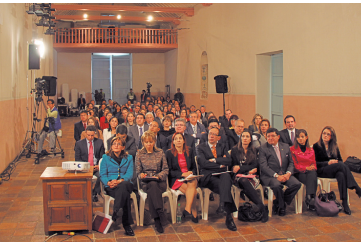
Procuradores delegados, jefes de oficina, servidores de la Entidad y ciudadanía en general llegaron al Claustro de San Agustín para hacer parte del ejercicio democrático.