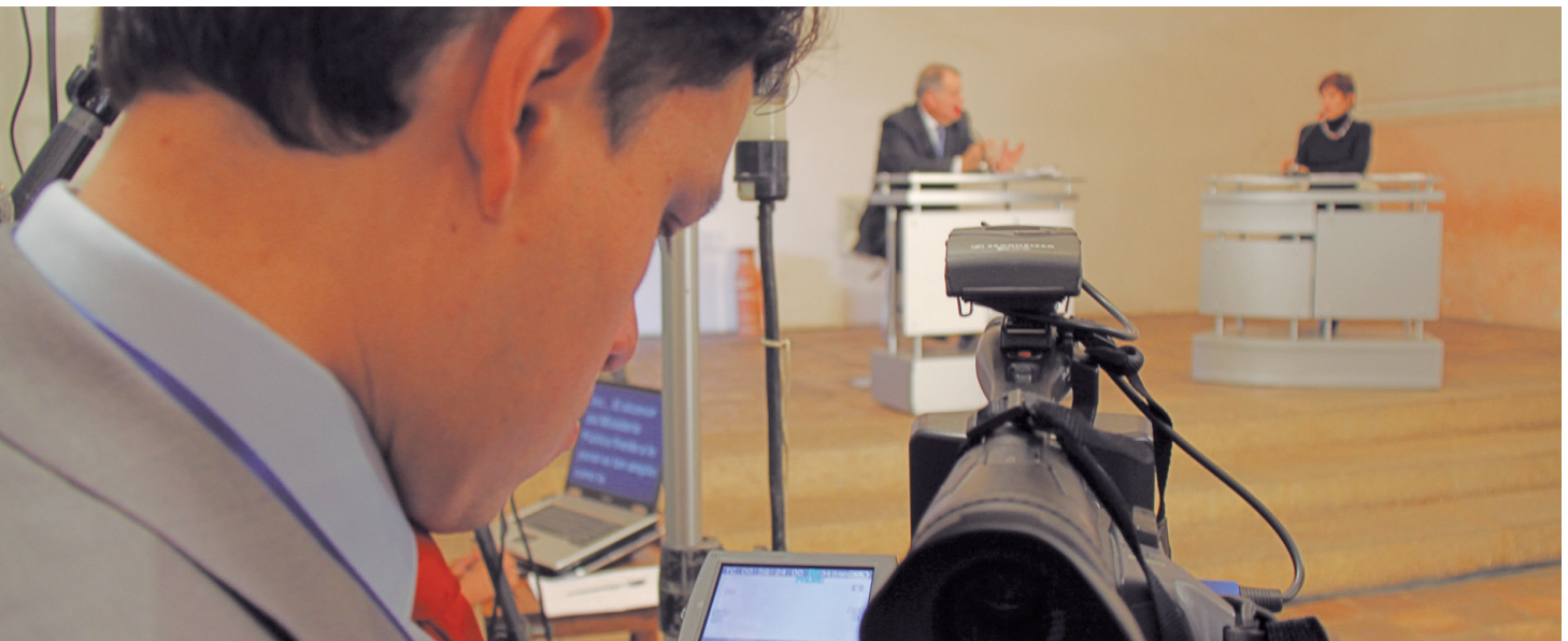
Gracias al equipo humano y técnico de la Procuraduría y el canal Señal Institucional, la audiencia de rendición de cuentas 2012 fue transmitida en vivo a través de televisión e internet.