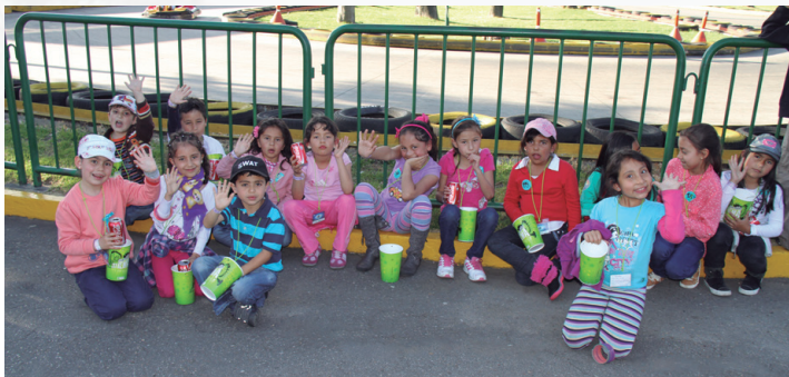
Al finalizar la tarde, los niños se deleitaron con unas ricas palomitas de maíz.