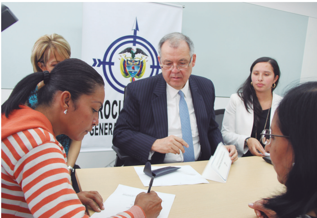
El procurador Alejandro Ordóñez ha liderado jornadas de conciliación civil y comercial, estrategia preventiva impulsada por su administración.

2012 fue un año de conciliación. En desarrollo de los programas diseñados en esta materia, la Procuraduría atendió a más de 9.000 usuarios a nivel central y adecuó centros regionales para las ciudades de Cali (Va-