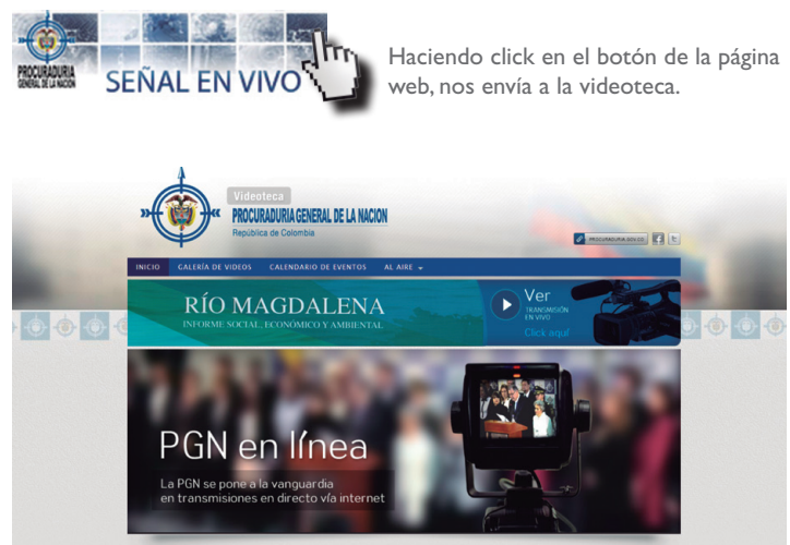
Haciendo click en el botón de la página web, nos envía a la videoteca.

Accediendo a este widget, ubicado en el portal de internet de la Procuraduría General de la Nación, los colombianos pueden acompañar en tiempo real y con una excelente calidad de audio y video los eventos institucionales del Ministerio Público.