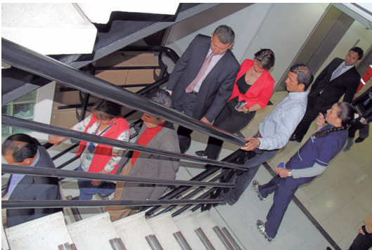
Descenso por las escaleras de la torre A.

Este ejercicio preventivo se adelantó en las sedes de la Entidad, ubicadas en Bogotá.