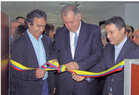
El procurador general, en compañía del gobernador de Antioquia y el alcalde de Medellín, desprende la cinta tricolor como símbolo de la inauguración.

La conciliación es la mejor opción para encontrar soluciones definitivas entre las partes, con la garantía de que estos acuerdos tienen la misma fuerza legal de una sentencia judicial.