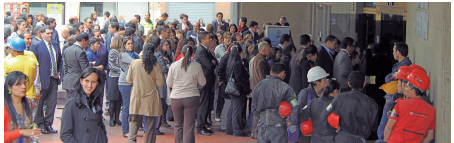
Retorno de los servidores a la Entidad.