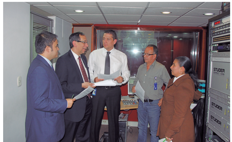
El grupo de producción del programa ‘ Orden y Rectitud ’ en consejo de redacción.