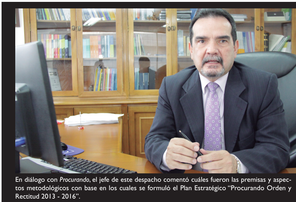
En diálogo con Procurando , el jefe de este despacho comentó cuáles fueron las premisas y aspectos metodológicos con base en los cuales se formuló el Plan Estratégico “Procurando Orden y Rectitud 2013 - 2016”.

En el diagnóstico externo se analizan aspectos como ¿qué afecta a la comunidad?, ¿hay corrupción?, ¿hay violaciones a los derechos humanos?, ¿cómo se están manifestan-