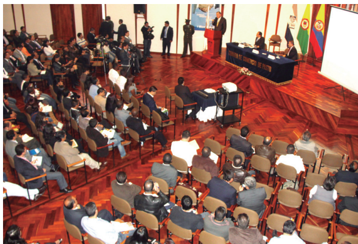
En 2012 los resultados del IGA fueron socializados en Bogotá y en los departamentos de Boyacá, Caquetá y Valle del Cauca.