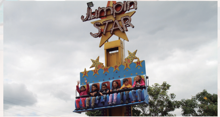
Los más pequeños también se divirtieron en el "Jumpin Star".