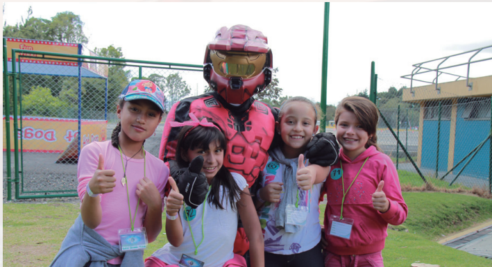
Las "super chicas" acompañadas de su "súper héroe".