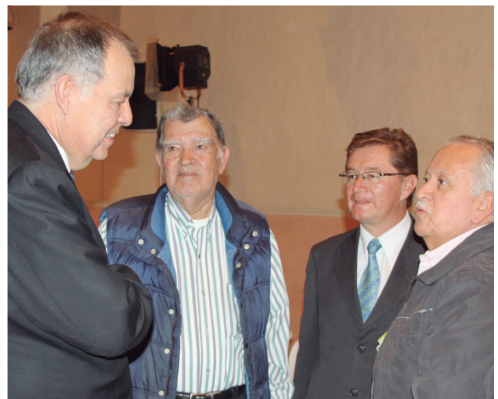
La ciudadanía, base de la gestión misional de la Procuraduría General de la Nación, participó activamente en la presentación del Informe de Gestión 2012.