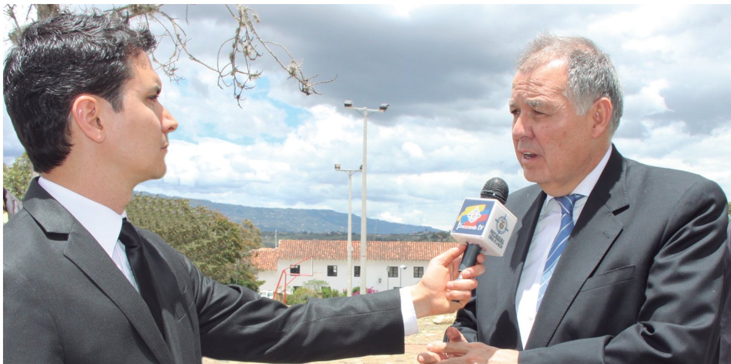
En el 2012 las actuaciones de la Procuraduría General de la Nación fueron informadas oportunamente a los medios de comunicación.

Por otra parte, se fortaleció la estrategia de videoconferencias, sistema que entró en