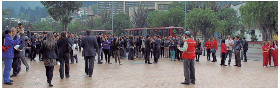
Congregados en el Parque de los Periodistas para el llamado a lista.