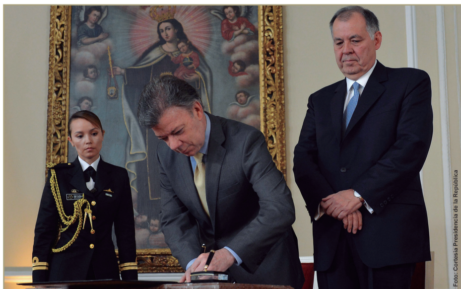
El presidente de la República, Juan Manuel Santos Calderón, suscribe el acta de posesión del procurador general de la Nación, Alejandro Ordóñez Maldonado, elegido para el periodo 2013-2016.

Les confieso que estos episodios no me causaron ninguna amargura, no quedó la menor herida en mi corazón. A quienes quisieron hacerme daño, los perdoné al día siguiente de mi elección, pero más aún les agradecí; a ellos les agradezco cotidianamente porque me permiten ejercer la virtud cristiana de la paciencia. Ya se me había olvidado, a esas personas las recordé esta mañana cuando mi mujer me insistía que debía dirigir algunas palabras. Resistí las primeras embestidas pero ustedes comprenderán cuál es la intensidad de una costeña santanderianizada; completo 30 años soportando el suave yugo. El recuerdo de estos episodios lo hago sin la menor dosis de resentimiento, solo lo hago para resaltar que con el final feliz que hoy se convalida, salió fortalecido nuestro ordenamiento jurídico.