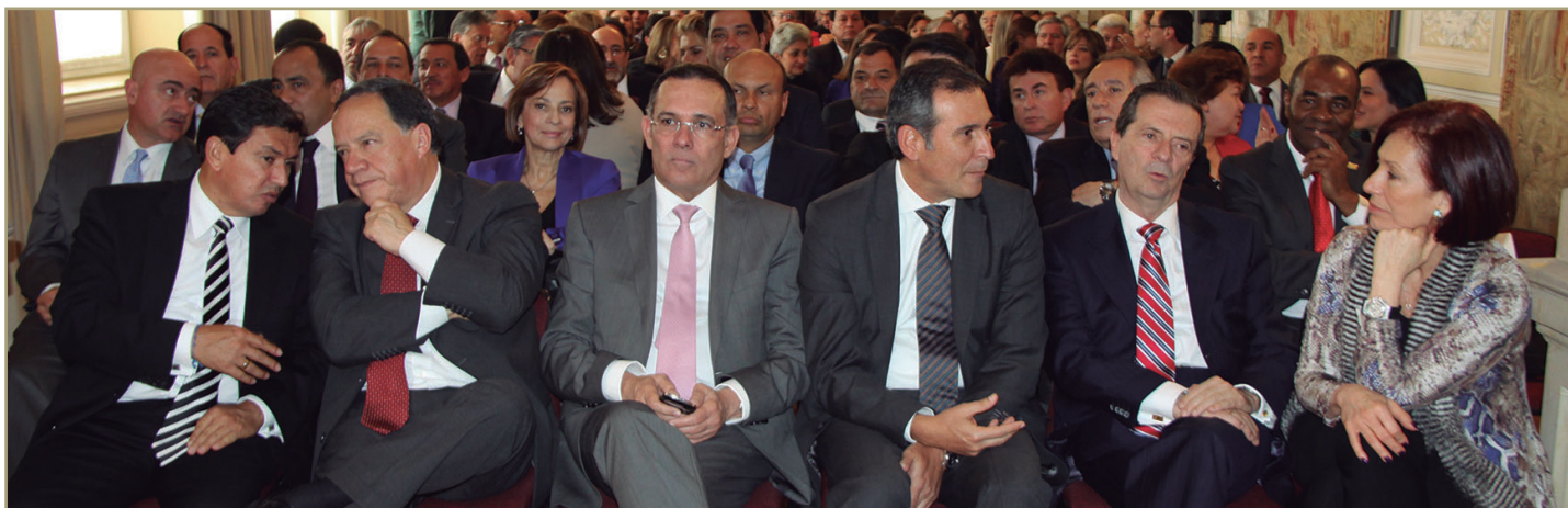
Personalidades de los diferentes poderes del país y miembros del equipo de trabajo del procurador general de la Nación, Alejandro Ordoñez Maldonado, asistieron al acto de posesión en la Presidencia de la República.

esa pluralidad que hoy se exige como ingrediente legitimador de los sistemas políticos. Acabo de jurar ante Dios y ante la Patria: cumpliré escrupulosamente mis roles constitucionales. No acostumbro a hacer perjuicio, mi formación religiosa, intelectual, jurídica y judicial son una garantía, el país lo sabe.