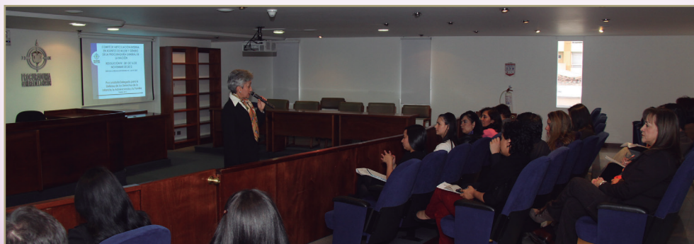
En la sala de audiencias de la sede central de la Entidad, se llevó a cabo la instalación formal del Comité de Articulación Interna en Asuntos de Mujer y Género.

Entre los objetivos de este comité se encuentran el de implementar la efectiva transversalización del enfoque de género en las funciones misionales