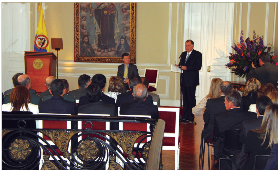
El primer mandatario y los más de 200 asistentes escuchan atentos la intervención del procurador general de la Nación, Alejandro Ordóñez, en el célebre ‘Salón Gobelinos’ de la Casa de Nariño.

“ S eñor presidente: concluye un año largo, muy largo, que precedió a mi elección, sometido a una especie de matoneo o bulling mediático; recuerden que este consiste en una serie de pugnas que se suscitan al interior de los escenarios escolares, donde se pretende apocar, reducir, aplanar, amedrentar; excluir socialmente e intimidar emocional e intelectualmente a la víctima. Lo anterior, más que un atentado personal, fue un enjuiciamiento al talante que encarno. Estuvimos verdaderamente amenazados por una especie de reedición del delito de opinión; si ello hubiera prosperado, me hubiera declarado como el primer discriminado del país y conmigo la mayoría de los colombianos que piensan lo que piensa el procurador sobre temas esenciales de nuestra identidad cultural, sin que para ello se coloquen por fuera de nuestro ordenamiento constitucional, sino todo lo contrario, que se encuentran protegidos en él.