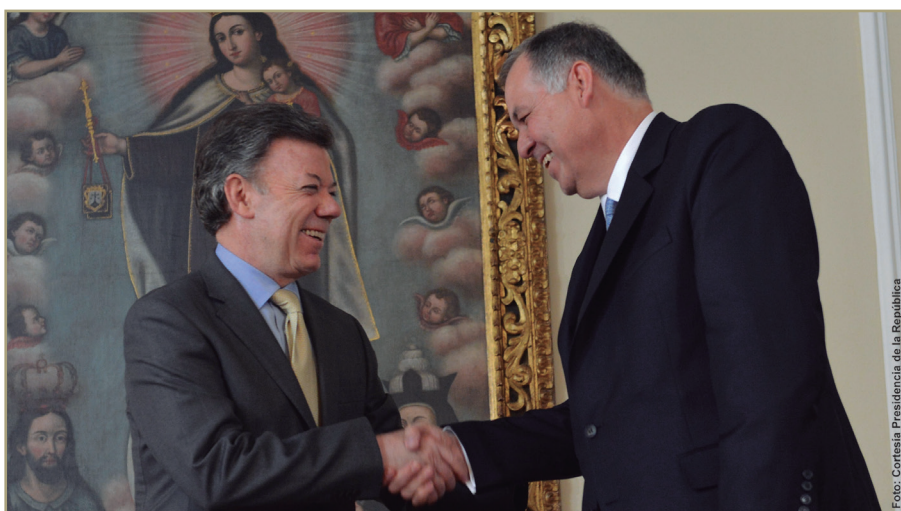
Al estrechar sus manos el presidente de la República, Juan Manuel Santos Calderón y el procurador general de la Nación reafirmaron su compromiso de trabajar de manera armónica y respetuosa, como le exige la Constitución.