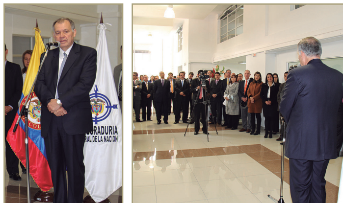
El procurador Alejandro Ordóñez Maldonado inauguró el centro de conciliación puesto al servicio de la ciudadanía.

En los procesos conciliatorios la Procuraduría ocupa una posición neutral para mediar en la concertación de voluntades; con esta práctica se permite un acceso efectivo, ágil e inmediato a la justicia con procedimientos idóneos, menos formales, más rápidos y sin costo alguno, promoviendo la participación ciudadana en la solución de sus conflictos. P