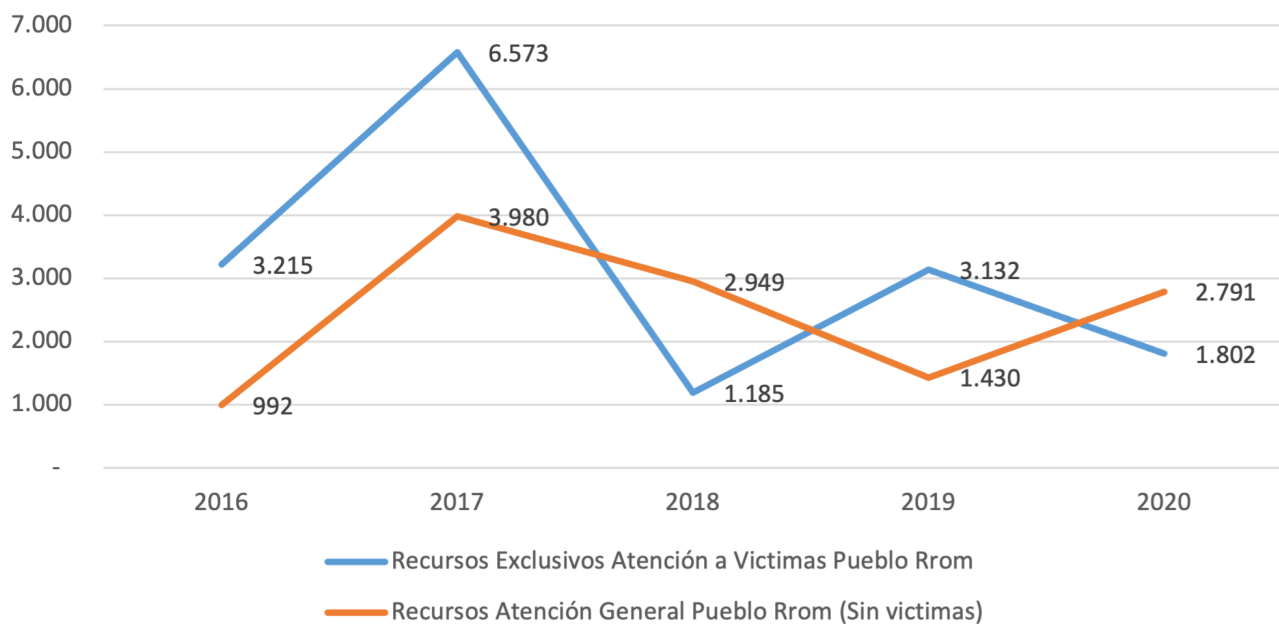
Gráfica 1. Presupuesto apropiado para el pueblo Rrom por tipo de proyecto y vigencia Cifras en millones de pesos