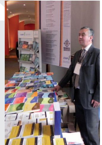
Dentro del Plan Operativo Anual (POA) 2012 del IEMP, está proyectada la edición de cerca de 60 publicaciones.

La responsabilidad social del IEMP también se verá reflejada en actividades como la socialización del estudio denominado Nuevo ciudadano colombiano, su participación en la red de escuelas del sector público, las jornadas de reflexión en materia de pensiones, regalías y reforma a la justicia, así como su apoyo al Centro de Arbitramento de la PGN. Adicionalmente, se fortalecerá el talento humano que hace parte de la