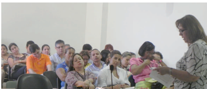
Capacitación sobre el manejo y contenido del Sistema de Relatoría en la ciudad de Santa Marta.