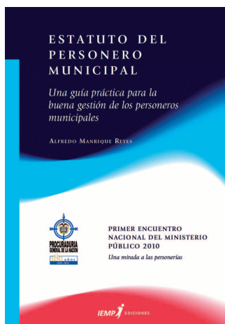
📖 Estatuto del Personero Municipal.