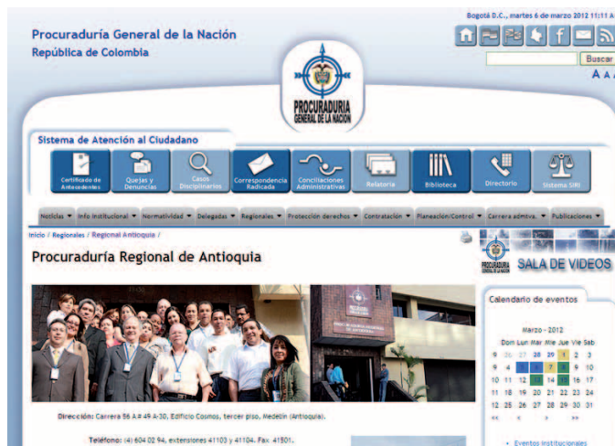
Subpágina de la Procuraduría Regional de Antioquia.

Para ofrecer aportes o sugerencias a este proyecto, escriba al correo electrónico webmaster@procuraduria.gov.co