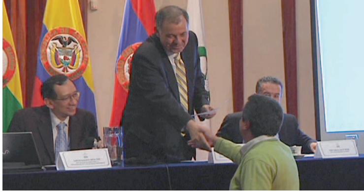
➤ Cada uno de los alcaldes del departamento de Nariño recibió de manos del procurador general, el resultado de Índice de Gobierno Abierto (IGA).

La agenda de los próximos conversatorios puede consultarse en la página institucional www.procuraduria.gov.co . P