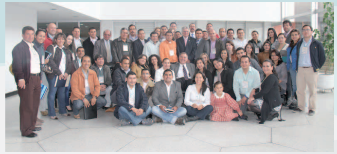
🏠 Cuarto Encuentro Departamental de Personeros Municipales en Tunja, Boyacá.

namiento del territorio municipal o distrital, entendido como el conjunto de directrices, políticas, estrategias, metas, programas, actuaciones y normas que debe adoptar cada municipio para orientar y administrar el desarrollo físico de su territorio y la utilización del suelo, tarea que debe ser supervisada por el vocero natural de la misma y defensor del interés general, el personero municipal, quien asumirá de manera preventiva las actividades propias de su competencia para lograr el cometido esperado.