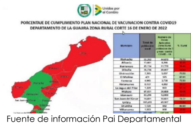
Fuente de información Pai Departamental