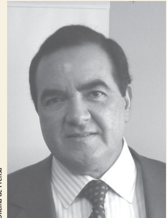
Oficina de Prensa

Conviene también precisar, como se anotó en el concepto, que si bien existe un pronunciamiento anterior de la Corte sobre las disposiciones ahora demandadas, que es la sentencia C-038 del 2004, la misma ley, en lo que podría denominarse una normatividad con permanencia precaria, previó que ésta sería objeto de una revisión perió-