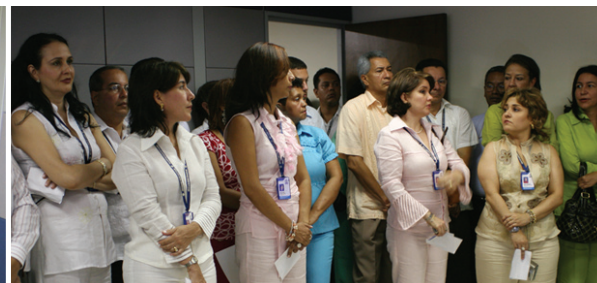
Inauguración Provincial Barranquilla. 8 de agosto de 2007.