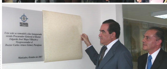
Reinauguración Regional Caldas. 16 de octubre de 2007