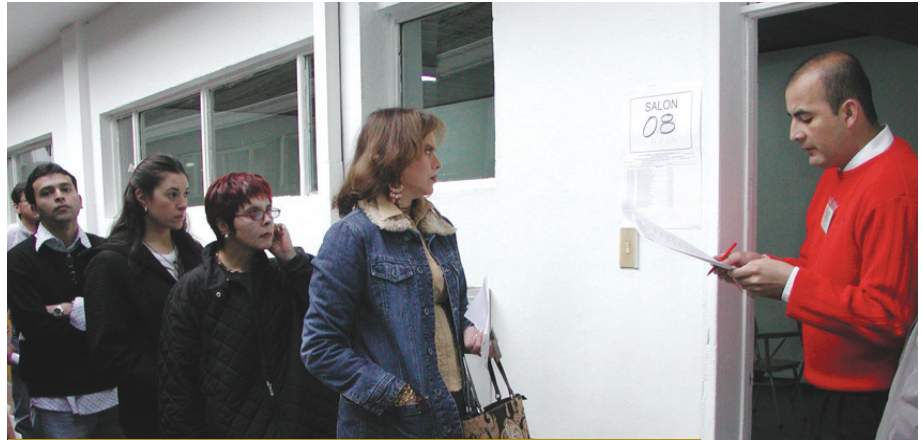
Llamado a lista de los concursantes durante la aplicación de la prueba de conocimientos.

La jornada se desarrolló exitosamente, gracias a un gran operativo logístico y al despliegue de 1.219 personas en todo el país para