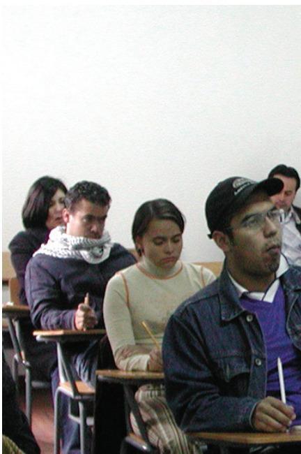
Concursantes admitidos para presentar la prueba de conocimientos.

El 21 de octubre pasado, la PGN con apoyo del Icfes, aplicó en 32 departamentos y 12 sitios en Bogotá, las pruebas de conocimientos y psicotécnica al 76% del total de los concursantes.