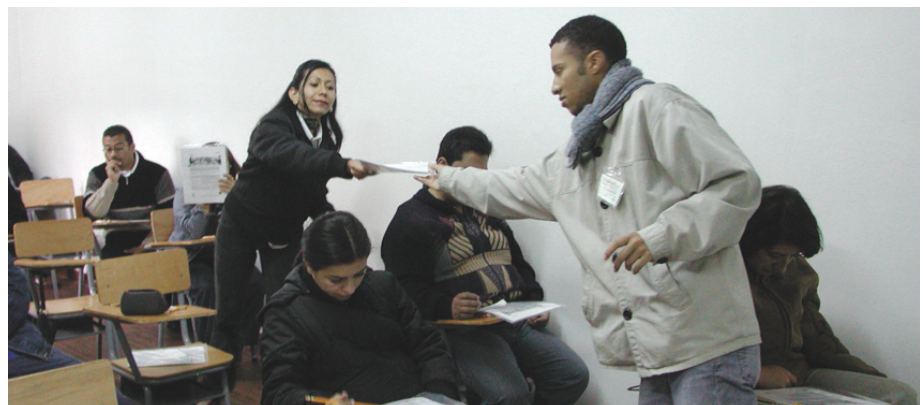
Aplicación de la prueba de conocimientos.