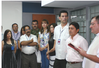
Reinauguración procuradurías judiciales de Villavicencio. 13 de septiembre de 2007.