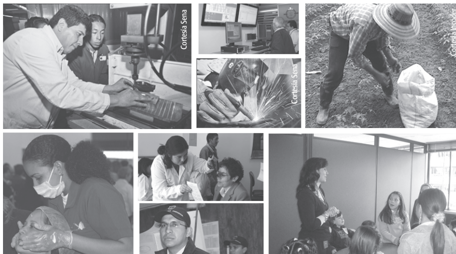
La Procuraduría General de la Nación emitió concepto sobre la constitucionalidad de la reforma laboral que acabó con algunos derechos de los trabajadores.

Publicado en el diario Portafolio el 23 de Octubre de 2007