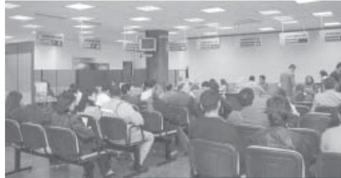
Centro de Atención al Público de Bogotá

Desde las aulas universitarias y repasando nuestro decálogo, valor por valor: Libertad, Honestidad, Justicia, Responsabilidad, Respeto, Tolerancia, Compromiso, Transparencia, Solidaridad y Efectividad, vamos abonando el camino. Los educandos quedan con la inquietud sembrada, asumen una actitud de investigar respecto de los valores y entienden que la idea no es