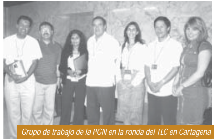
Grupo de trabajo de la PGN en la ronda del TLC en Cartagena

turales e identificación de las potencialidades económicas regionales, sin la cual no será posible ponernos a tono con las exigencias del tratado. Es más, su implementación en el corto, mediano y largo plazo es un compromiso y una exigencia para el actual y los futuros planes de desarrollo nacional y regional, pero su implementación estará condicionada a las fuentes disponibles de financiamiento, ello, en todo caso, sin sujeción a la firma del tratado.