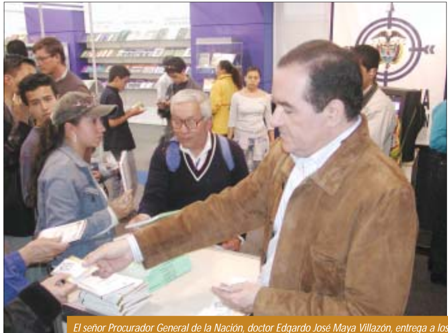
El señor Procurador General de la Nación, doctor Edgardo José Maya Villazón, entrega a los funcionarios públicos y asistentes interesados en las temáticas que maneja la Procuraduría, un total de 7.500 ejemplares de diferentes obras en las que se difunde la labor de la PGN.

Además por primera vez la PGN participó en el segundo encuentro empresarial Expogestión 2005, evento al que asistimos por invitación de LEGIS, dentro del proyecto de Gestión Ética que adelanta la Entidad.