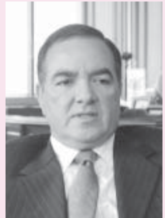
Procurador General de la Nación Edgardo José Maya Villazón

Finalmente, quiero llamar la atención sobre el convenio que fir-