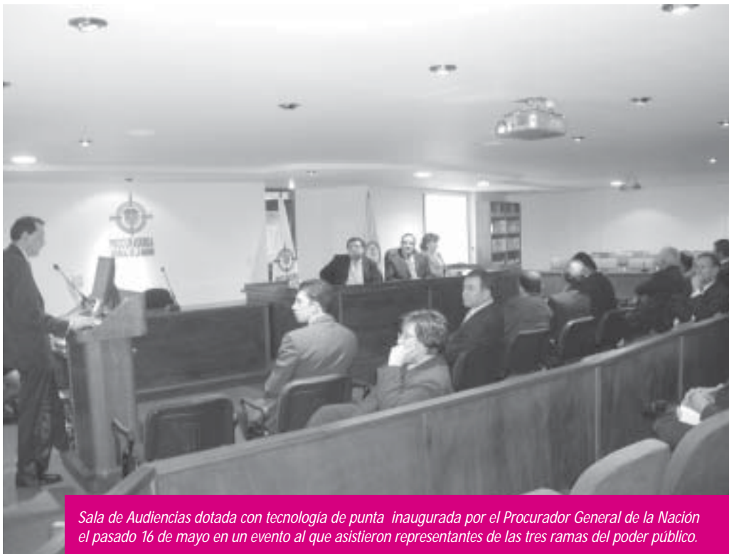
Sala de Audiencias dotada con tecnología de punta inaugurada por el Procurador General de la Nación el pasado 16 de mayo en un evento al que asistieron representantes de las tres ramas del poder público.

Este es uno de los componentes fundamentales para el fortalecimiento del área de "Servicio al Ciudadano", dentro del Programa de Modernización de la Procuraduría apoyado por el BID, que tiene previsto además adecuar otras Salas en las ciudades de Barranquilla, Medellín, Cali y Bucaramanga.