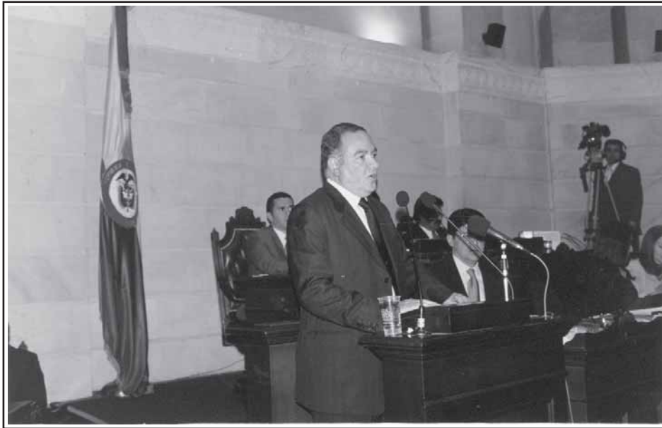
Palabras de agradecimiento del Procurador General ante el Senado de la República luego de su reelección el pasado 9 de noviembre

S eñor Presidente del Senado de la República Señor Vicepresidente del Senado Honorables Senadores: