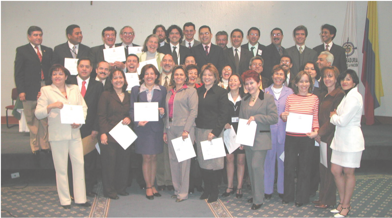
Clausura Diplomado en Talento Humano y Renovación Organizacional; 28 de mayo de 2004

Con una sobria ceremonia realizada en el Auditorio Antonio Nariño, el pasado 28 de mayo se clausuró el Diplomado en Talento Humano y Renovación Organizacional realizado por la Procuraduría General de la Nación, a través del Instituto de Estudios del Ministerio Público.