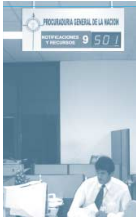
Proyecto Piloto Centro de Notificaciones y Recursos.

ACCIONES DE CONTROL EXISTENTES. Frente a este riesgo se han adoptado acciones para contrarrestar sus