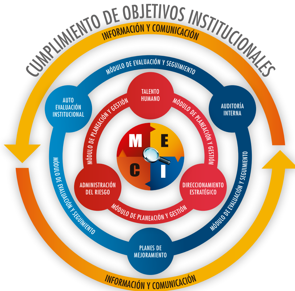
Ilustración 1. Estructura del Modelo Estándar de Control Interno

El gráfico que a continuación se muestra permite observar la estructura del MECI: